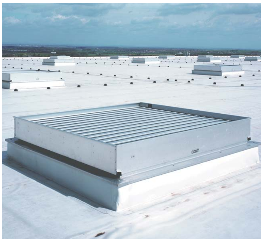
▲ Gravitációs hő- és füstelvezető berendezés

A Colt EuroCO zsals lamellás szellőztető berendezés a füst és a hó automatikus elvezetéséhez. A tűzvédelmi szellőztető funkció mellett a természetes szellőztetést, valamint a természetes megvilágítást is biztosítja. Alkalmazási terület: iparban, szolgáltató szférában, és közintézményekben.