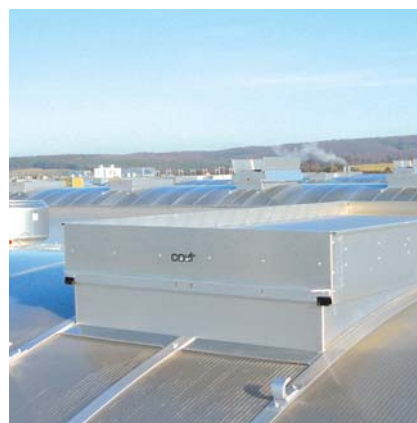
▲ EuroCO egy bevásárló központban