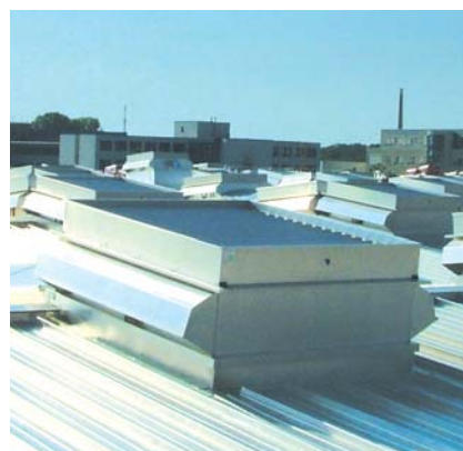
▲ EuroCO a Weatherlite lábazatrendszerrel a beázás mentes szellőztetéshez